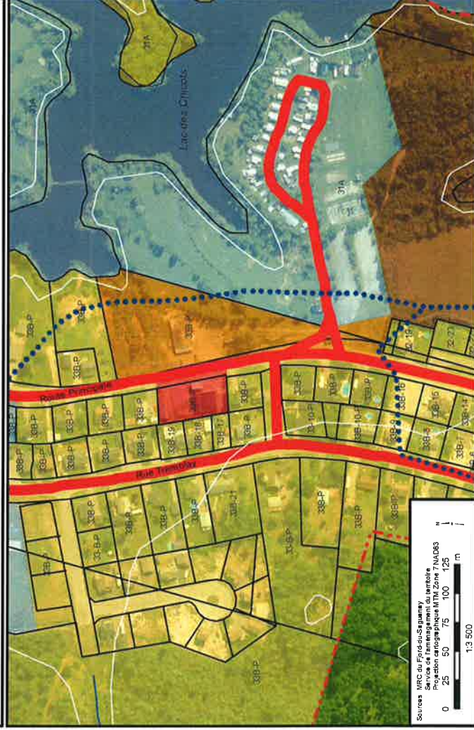
Plan 1b: Après modification du plan d'urbanisme - secteur urbain