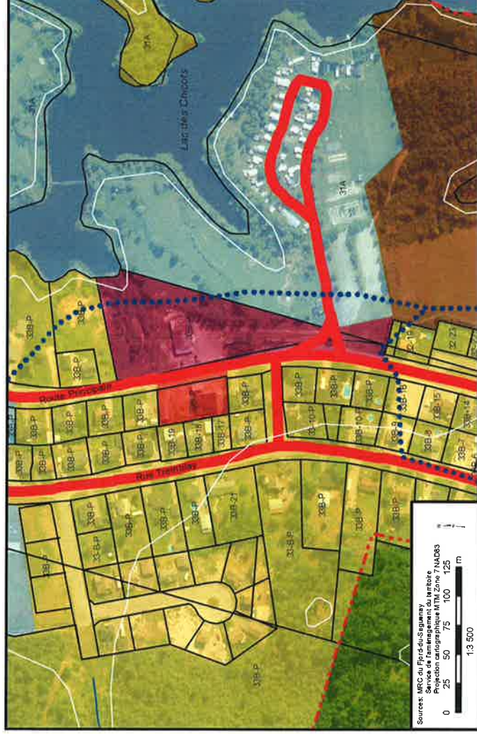
Plan 1a: Avant modification du plan d'urbanisme - secteur urbain